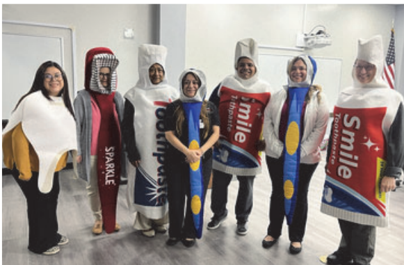
UTHealth Houston organizó un taller para informar a los profesionales de la salud sobre la importancia de la salud bucal y la atención odontológica regular para adultos con DD.

El Centro de Ciencias de la Salud de la Universidad de Texas en Houston desarrolló un programa de capacitación innovador en atención colaborativa para personas con DD en las facultades de odontología y medicina de todo Texas. El proyecto involucró a odontólogos para trabajar con un equipo de profesionales provenientes de los ámbitos de la atención médica, la atención odontológica y la salud del comportamiento. El TCDD apoyó este trabajo para brindar a los profesionales de la atención médica y de la atención odontológica una comprensión más profunda de cómo la discriminación en equidad en materia de salud afecta a las personas con DD. La iniciativa incluyó proyectos adicionales coordinados por la Facultad de Medicina de Baylor y la Universidad de Houston-Clear Lake.