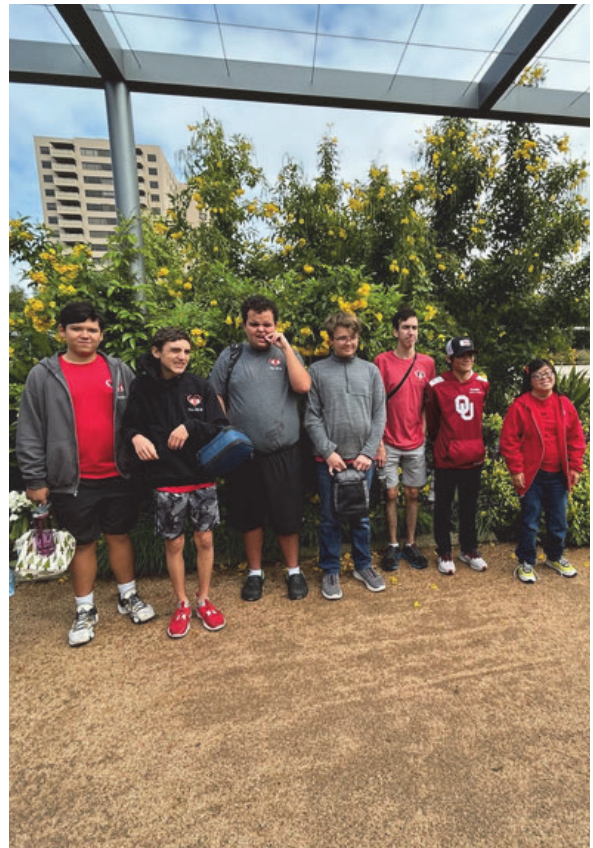
Los estudiantes con DD de HUB Houston se unieron a los coordinadores de la comunidad de personas con discapacidades, a maestros jardineros y al agente de horticultura del Servicio de Extensión del Condado de Harris para un recorrido de jardinería inclusivo en Houston Centennial Garden. HUB planea diseñar su propio jardín sensorial en el futuro.

Después de revisar este informe y conocer más sobre nuestro trabajo, le invitamos a crear su propia conexión. Comuníquese con nosotros, continúe la conversación y ayúdenos a mejorar las vidas de las personas con DD en todo Texas.